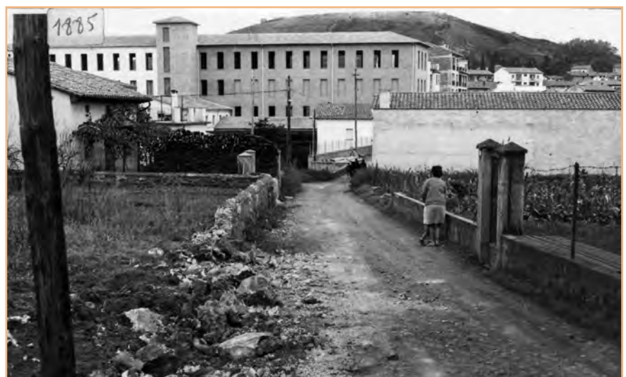
FIGURA 3. Panoràmica abans de 1970 mentre es basteix la fàbrica Monvervi. S'hi aprecia un espai humanitzat: agrícola, industrial i alhora urbanitzat. L'any en què es va construir l'anomenat «pont de la ceràmica» que va permetre el pas dels nous autobusos de transport.

Mentre es construeix el nou edifici fabril (figura 3), la marxa de la societat continua en progressió ascendent; de fet, coincideix plenament amb les dades de J. Maluquer de Motes i Bernet (1998, p. 186) quan atribueix al sector alimentari un incre-