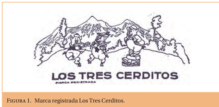
FIGURA 1. Marca registrada Los Tres Cerditos.

Des d'una perspectiva actual, aprofundint en què va impel·lir els joves empresaris a voler adoptar aquest nom com a marca amb una caràtula de muntanyes i tres porquets al davant vestits com al film i acompanyats de diferents instruments: una flauta, un violí i a sobre d'un totxo amb eines de paleta el tercer, fa pensar, en primer lloc, en una