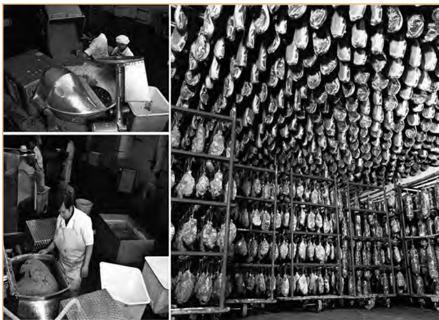
FIGURA 4. Nau d'assecatge i de curació de diferents productes: pernil, cansalada viada, xoriç, llonganissa. Procés de trinxat i de pastat al buit de la carn.

La descripció ens permet conèixer l'equipament de la nova fàbrica amb la maquinària i les seves instal·lacions especials i necessàries, com ara muntacàrregues, aigua calenta, instal·lació elèctrica i de força, els fluorescents i el quadre de comandaments, amb un valor de 350.000 pessetes (figura 4). Estava considerada entre les empreses que consumien 112 quilowatts. També una picadora de carn amb un electromotor de 2 hp valorada en 23.000 pessetes; una picadora de carn amb electromotor de 3 hp valorada en 28.000 pessetes; una talladora de carn tipus Cutter amb electromotor de 20 hp valorada en 160.000 pessetes; una pastadora al buit amb electromotors de 3 1/2 i 1 hp, respectivament, valorada en 120.000 pessetes; una pastadora al buit amb electromotors de 5 1/2 i 2 hp, respectivament, valorada en 169.000 pessetes; una embotidora amb electromotor de 3 hp valorada en 42.000 pessetes; una embotidora automàtica amb electromotor de 20 hp valorada en 210.000 pessetes; una talladora de carn en llenques amb electromotor de 4 hp valorada en 30.000 pessetes; una màquina d'esclovellar amb electromotor de 2,5 hp